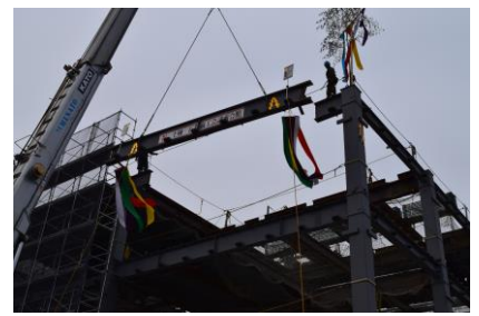
3 階部分の梁がクレーンで持ち上げられた