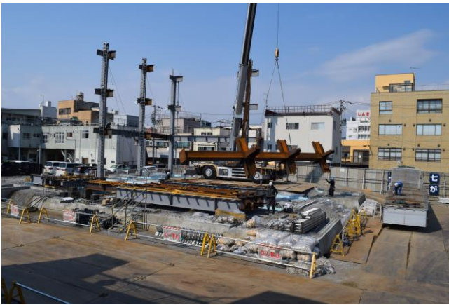
鉄骨の組立工事がはじまった現場(撮影:4月3日)

日に日に新しい会館の形が現れてきました。1 階の天井までの高さは 4m、2 階、3 階の天井までの高さは 2.8m で、基礎部分が 1m 嵩上げしていることから、4 階位の高さの建物になります。