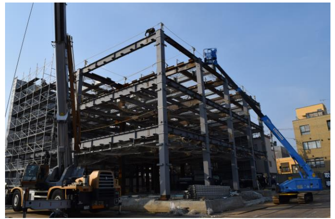
鉄骨が組み立てられ会館の大きさが見えてきた(撮影:4月14日)