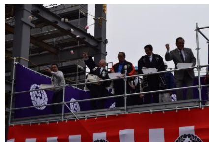
多くの住民が来た餅まき風景